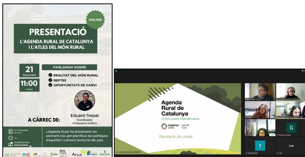
Cartell informatiu i captura de pantalla de la sessió online del dia 21 de desembre