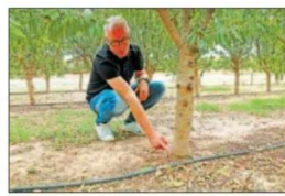
Aquest portaempelt l'ha fet IRTA i és eficient en l'ús d'aigua

És un híbrid d'ametller i presseguer de baix rigor