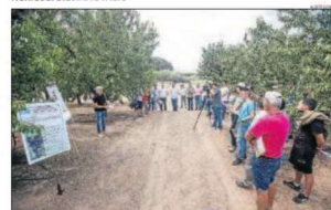
La presentació d'intensiu obri a la finca experimental de l'IRTA a les Borges.